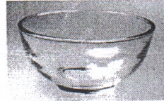
Chén chấm TT